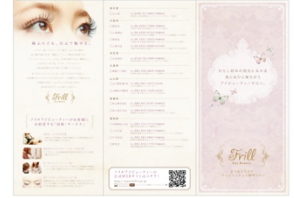
ブランドリーフレット