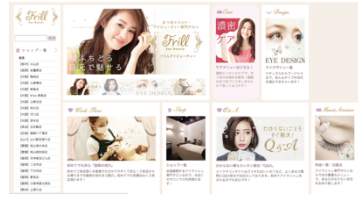
ブランドポータルサイト